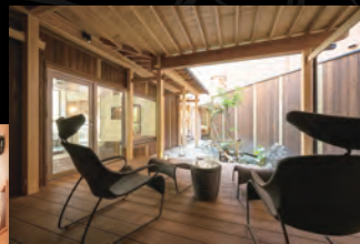
【つれづれの湯】 整い場（外気浴スペース）