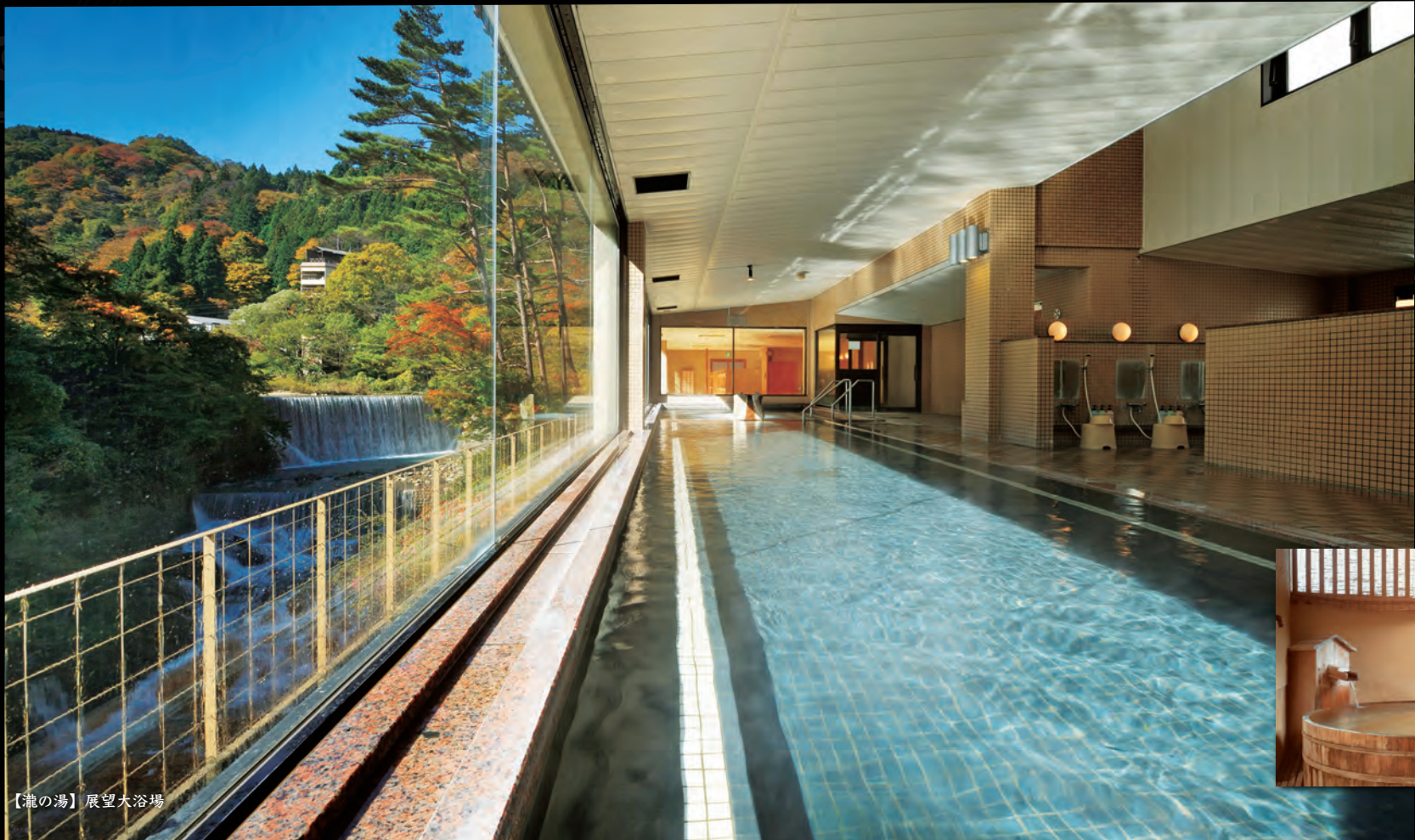
【瀧の湯】展望大浴場