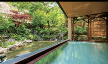
【たまゆらの湯】露天風呂