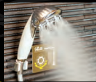
【一階大浴場】 全シャワーヘッド