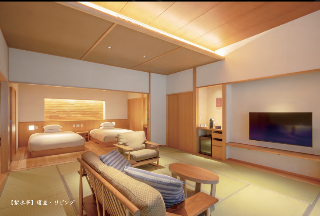
【紫水亭】寝室・リビング