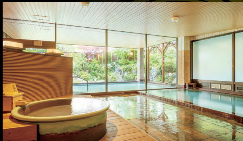
【たまゆらの湯】大浴場・水風呂