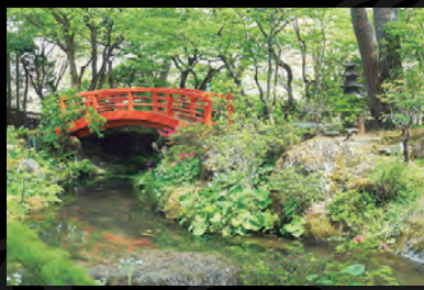
かちようえん 花鳥苑