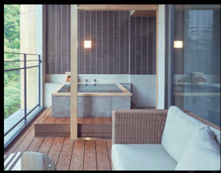
【紫水亭】客室テラス

しすいてい 紫水亭 露天風呂・半露天風呂・テラス付客室 お部屋で源泉かけ流しの贅沢。