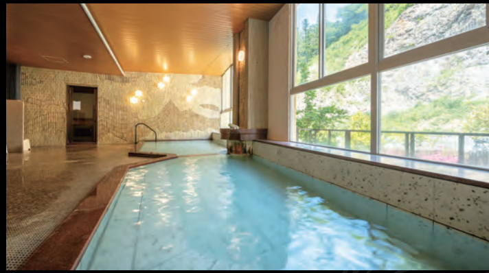
【つれづれの湯】大浴場