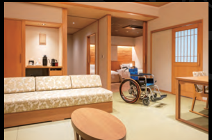
【紫水亭】ユニバーサルスイートルーム