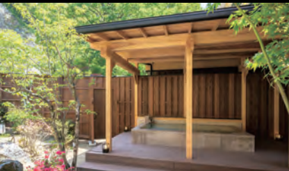
【つれづれの湯】露天風呂