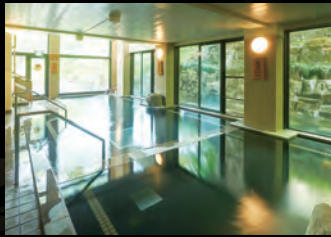
【淵の湯】深湯・浅湯