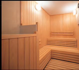
【つれづれの湯・たまゆらの湯】 ロウリュサウナ